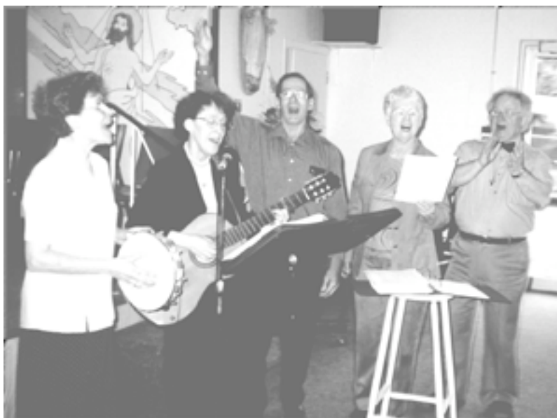
Photo prise à la messe de clôture du jeudi matin, 18 avril 2002, lors du Colloque des leaders du Renouveau charismatique, à Granby.

La joie chrétienne n'est pas nécessairement exubérante, une joie d'adolescence. La joie a des âges ! Mais toujours elle doit paraître dans notre regard, dans nos paroles et dans notre vie. « Que le rayonnement de notre sérénité soit à lui seul un apostolat » (V. Germain). Quelqu'un a écrit : « Ce n'est pas plus difficile de faire un sourire que de faire une grimace. Ordinairement, c'est plus joli ». Ne rabâchons pas le récit de nos bobos et les malheurs des temps. Un ami me disait : « Ce n'est pas en brassant du fumier qu'on fait du sirop d'érable ». ➤