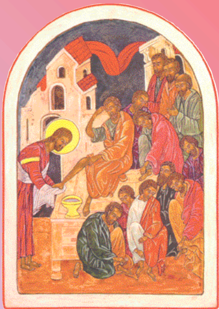
Icône : Gracieuseté de l'artiste, Gilberte Massicote-Éthier Site Web : http://www.massicotte-ethier.com/

Ceux qui craignent le Seigneur, leur esprit vivra, car leur espérance s'appuie sur qui peut les sauver.