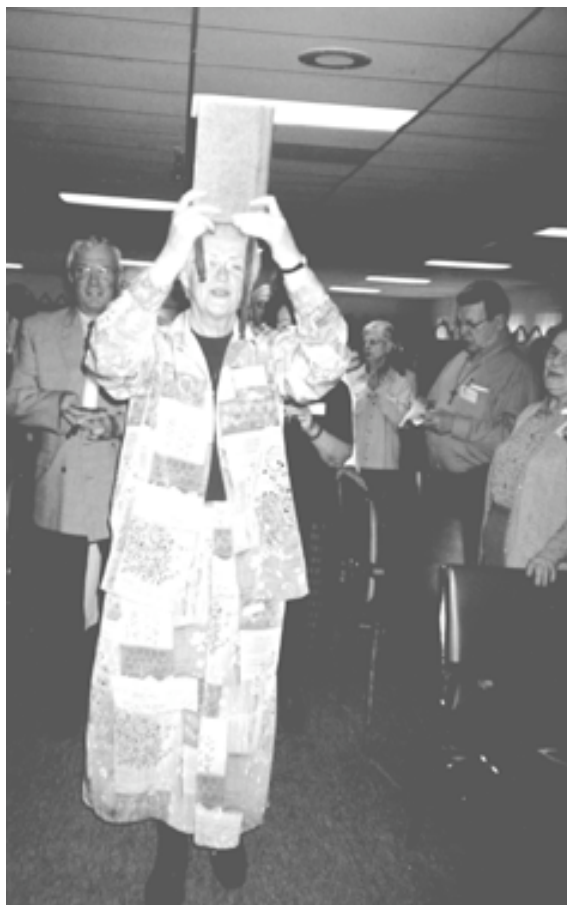
lors du Colloque 2002 à Granby